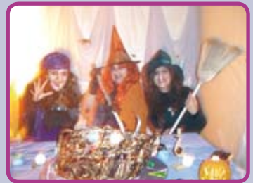
La cueva de las brujas

El día 13 de noviembre, el Ayuntamiento de Quer programó una charla sobre nutrición. Donde se habló sobre el deporte y la nutrición y a continuación se dieron fórmulas para controlar y bajar de peso de forma sana.