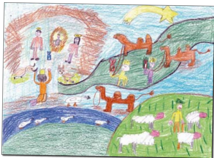
AUTOR: ALBERTO ALONSO. 8 AÑOS