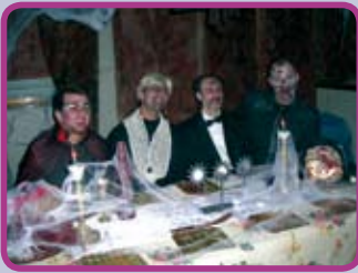
Comedor de época siniestro

La decoración fue realizada con materiales sencillos pero con un buen resultado consiguiendo el realismo que se pretendía. Se usó en su mayoría papel continuo, pinturas, telas, cartones y objetos de sus casas. Se crearon varios ambientes: la cueva de brujas, el comedor de época siniestro o el pasillo del terror.